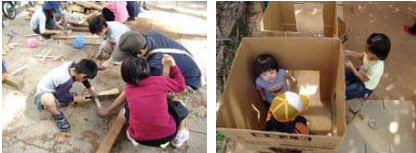
モデル事業: 「プレーパーク in 新屋敷公園」

■わいわい遊び場サポート事業 どこの地域にも子どもたちが集まって 「わいわい騒ぐ」遊び場がある。