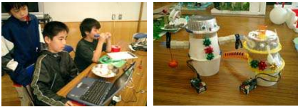
モデル事業: CAMPクレッタワークショップ「動くおもちゃをつくらう」

■うきうきアトリエ事業 まちかどの所々に「いろんなものを 自由につくれる」創作活動の場がある。