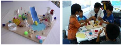
モデル事業: 「あつらいいな、こんな遊び場」

■うきうきアトリエ事業 まちかどの所々に「いろんなものを 自由につくれる」創作活動の場がある。