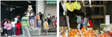
モデル事業: 「のうれんビーチ」

■どきどき現場発見事業 まちの限界や自然のフィールドの「現場」を ベースに「驚きや発見」の場がある。