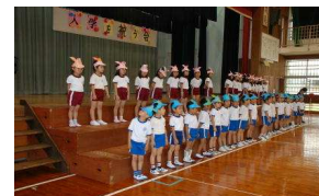
1年生を迎える会の様子

垣花小学校は那覇市の西部に位置し、近隣に奥武山公園・野球場・陸上競技場・県立武道館等の施設がある。校庭はふでかけ山の緑に囲まれ都市地区でありながら豊かな自然に恵まれている。在校生230名という小規模校の特色を活かし、どの子も楽しく学び、生き生きと活動する学校づくりに積極的に取り組んでいる。