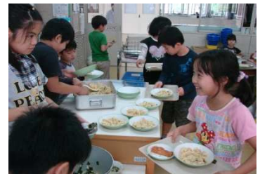
ニコニコデーは、1年～6年生が一緒に給食いただきます。