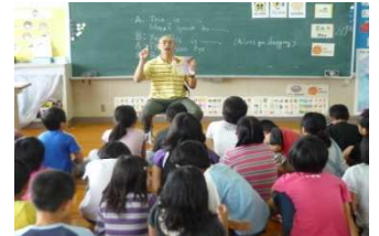
AETによる英語の授業

朝の基礎基本タイム(8:25~8:35)の充実 サマースクール 7月21日(木)~7月25日(月)の実施 生活リズムチェックと「はやね・はやおき・朝ご飯」の取り組み 個に応じた指導の充実、問題解決的学習の推進 平成23年度一事徹底事項「家庭学習の習慣化」の取り組み