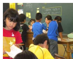
チャレンジタイム