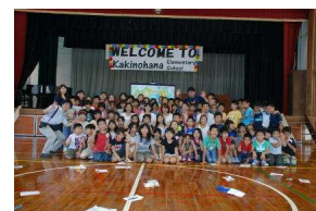
異文化交流会の様子