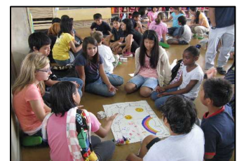
ステアリーハイツ校との交流の様子

算数：少人数指導 補習指導の工夫 道徳授業の公開 読書の重視 ステアリーハイツ校との交流