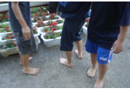
はだしの教育 学級の一事徹底

確かな学力の向上...たすきプラン 豊かな心の育成...きずなプラン 健康と体力の向上...すこやかプラン