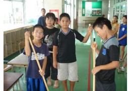
朝の縦割り活動 家庭の一事徹底