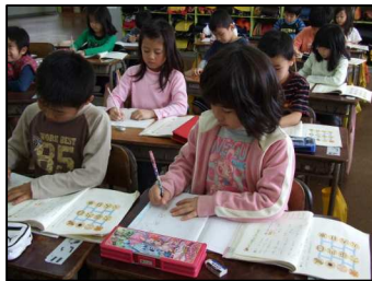
神原っ子きらきらプラン： よい姿勢

本校は、「子どものための学校」を学校経営の基本理念に掲げ、全教師が授業の指導方法の改善・充実に努め、教育目標の具現化に向けて信頼される教育活動を展開している。